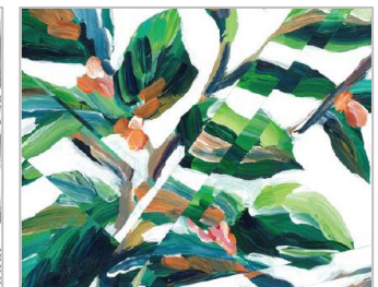
KUWA 【アーティスト名】 Witness