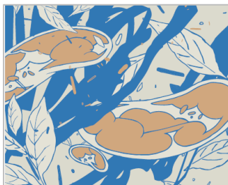
ORIGINAL 【アーティスト名】 WOK22